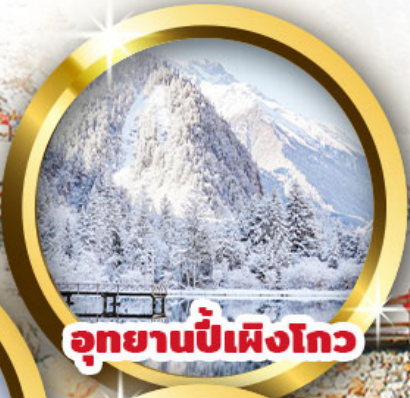
อุทยานปี้เฟิงโกว