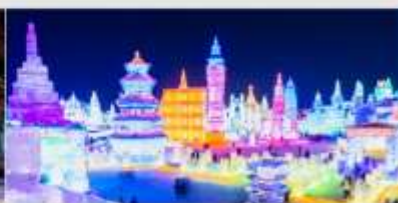
เทศกาลโคมไฟน้ำแข็ง