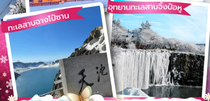
อุทยานทะเลสาบจิ่งป๋อหู่