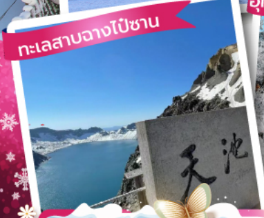
ทะเลสาบฉางไป่ชาน