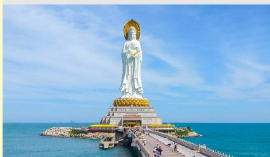
เจ้าแม่กวนอิมหนานซาน