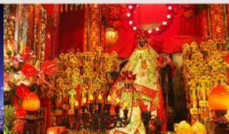
วัดเจ้าแม่กวนอิมของฮ่า

*ทางบริษัทฯ ขอสงวนสิทธิ์ในการลုပ်โปรแกรมทัวร์ตามความเหมาะสมขึ้นอยู่กับสถานการณ์หน้างาน โดยคำนึงถึงผลประโยชน์ของลูกค้าเป็นสำคัญ