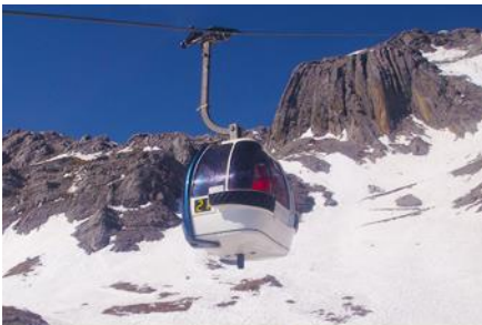
ภูเขาหิมะมังกรหยก (บันไดกระเช้าใหญ่)

ที่พัก FENG HUANG HOTEL ระดับ 4 ดาว หรือเทียบเท่าเมืองลี่เจียง