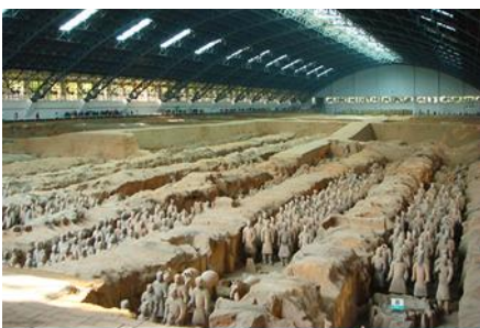
สุสานกวางกั๊กทหารม้าจีนซี

ค่ำ รับประทานอาหารค่ำ ณ ภัตตาคาร พักที่ XINYUAN HOTEL 4* หรือ โรงแรมในระดับเดียวกัน เมืองหั่วซ่าน