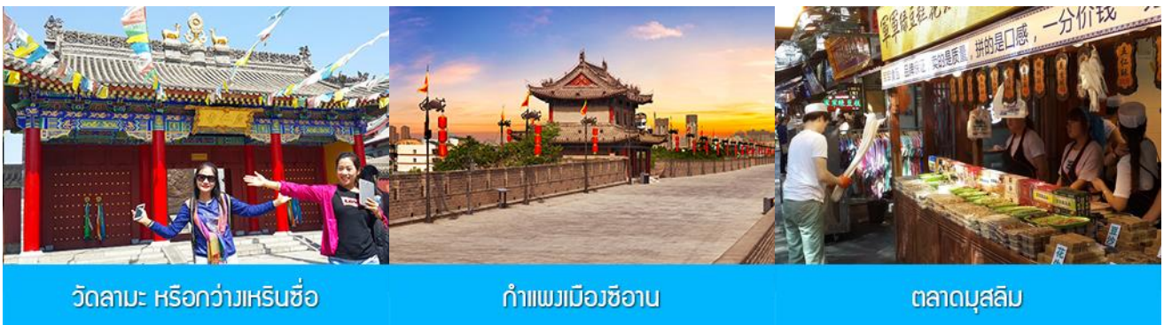
วัดลามะ หรือกว้างเหรินชื่อ

พักที่ TITAN CENTRAL PARK HOTEL 4* หรือ โรงแรมในระดับเดียวกัน เมืองซีอาน