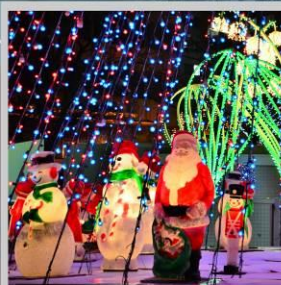
"ODORI GERMAN CHRISTMAS"