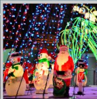
"ODORI GERMAN CHRISTMAS"