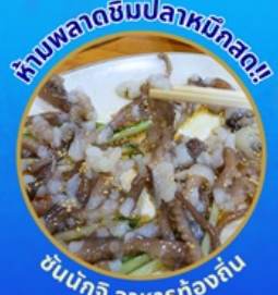
ห้ามพลาดชิมปลาหมึกสด!

โพลังสเปซวอล์ค สกายจอร์ค ตามรอยซีรีส์ Hometown chachacha ถ่ายรูปชิคๆ หมู่บ้านวัฒนธรรมคัมซอน ขึ้นเคเบิลคาร์ ชมทะเลปูซาน นั่งรถไฟปูคปิก sky capsule ชิมของอร่อยตลาดแฮนแด อิสระช้อปปิ้ง Lotte Duty Free