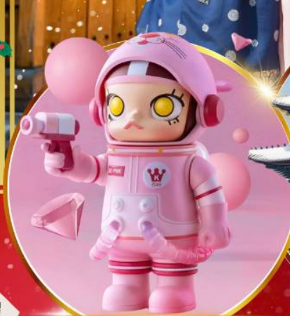
POP MART ฮงแด