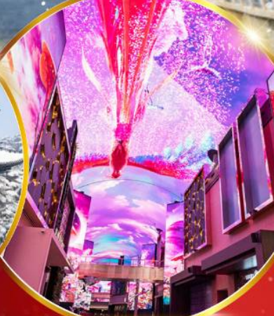
INSPIRE Entertainment Resort

ชมจอ LED ขนาดยักษ์ที่รีสอร์ท 5 ดาว ใหญ่ที่สุดในเอเชียเหนือ ชมพระราชวังคยองบกคุง ย่านอดีตหมู่บ้านบุคซอน ฮงแด ใส่ชุดฮันบก ทำข้าวห่อสาหร่าย อิสระช้อปปิ้ง Lotte Duty Free