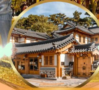
หมู่บ้านโบราณอินพยอง