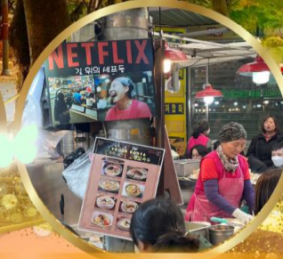
สตรีทฟู้ดตลาดกวางจ้ง