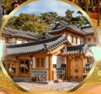
หมู่บ้านโบราณอินพยอง