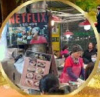
สตรีทฟู้ดตลาดกวางจิง