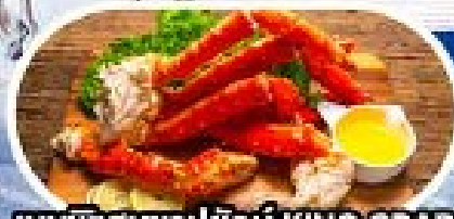
เมนูพิเศษซาปูยักษ์ KING CRAB