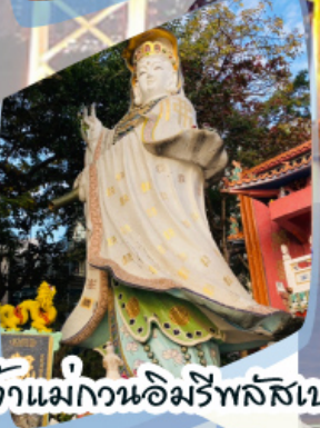
เจ้าแม่กวนอิมรัพลัสเบง