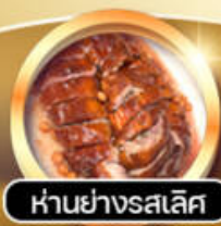
ห่านย่างรสเลิศ