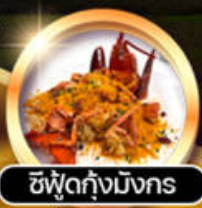
ซีฟู้ดกุ้งมังกร