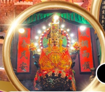
ขอพรซื้อขายอสังหาริมทรัพย์