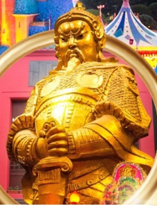
วัดเขกงหนิว

• ดิสนีย์แลนด์ (เต็มวัน) • วัดเขกงหนิว • อ่าวรีพัลส์เบย์