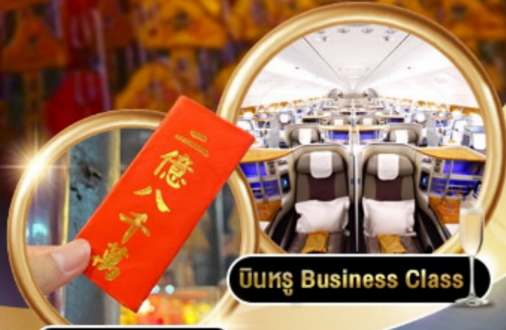
บินหรู Business Class