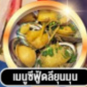
เมนูซีฟู้ดลือลุ่ม