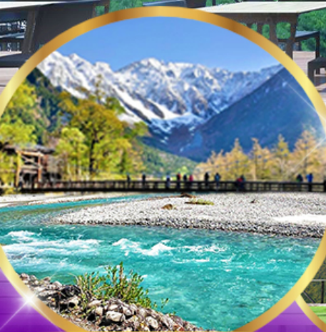
คามิโคจิ

21 - 25 ส.ค. 67 10 ที่สุดท้าย 28 ส.ค. - 1 ก.ย. 67 12 ที่สุดท้าย