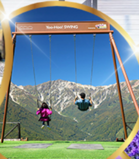
ชิงช้า Yoo hoo! Swing