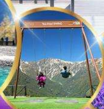
ชิงช้า Yoo hool Swing