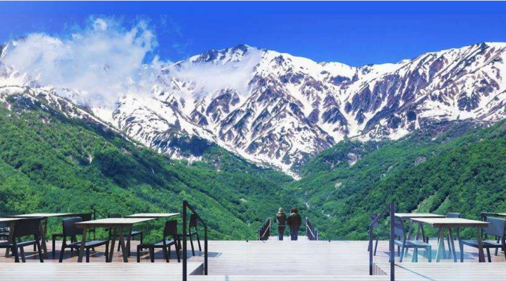
HAKUBA MOUNTAIN HARBOR

ไม่พลาดกับการชมวิวแบบพาโนรามา ณ Hakuba Mountain Harbor ด้วยทัศนียภาพที่เหนือ ชั้นของภูเขาโดยรอบ จุดเด่น คือ ระเบียง “Hakuba Sanzan” ที่สามารถเห็นเทือกเขาแอลป์แบบ 360 องศา ได้อย่างสวยงามในทุกฤดู สามารถยื่นถ่ายรูป และดื่มด่ำกับบรรยากาศได้อย่าง เต็มอิม ในบริเวณเดียวกันยังมีร้านเบเกอรี่ โดยทางเข้ามีที่นั่งบนระเบียง สามารถเพลิดเพลิน ไปกับการจิบเครื่องดื่มอุ่น ๆ พร้อมชมบรรยากาศตามอัธยาศัย