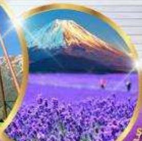
โออิชิ ปาร์ค