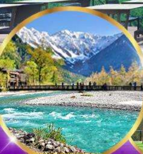
คามิโคจิ