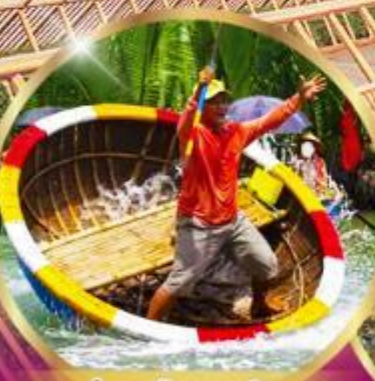
ล่องเรือกระดัง