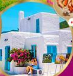
มารีนา คาเฟ่