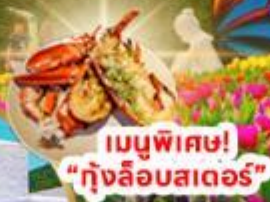
เมนูพิเศษ! "ทุ่งลือบสเตอร์"