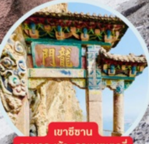
เขาสีซาน รวมกระเช้า+รถแบคเตอร์