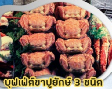
บุฟเฟ่ต์ขาปูยักษ์ 3 ชนิด