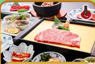
บั้งย่าง ROKKASEN