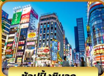
ช้อปบั้งชินจูกุ