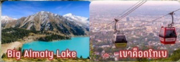
Big Almaty Lake