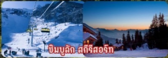
ป็นบุลิก สกีรีสอร์ท