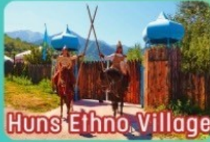
Huns Ethno Village