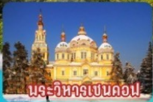
นระวิหารเขนคอฟ