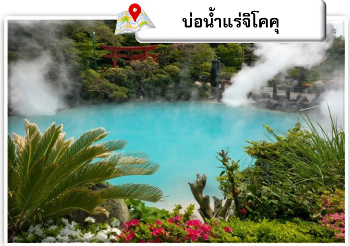
บ่อน้ำแร่จิโคคุ

เดินทางสู่ บ่อน้ำพุร้อน (Jigoku Meguri) หรือ บ่อน้ำพุร้อนชุมชนรทังแปด เป็นบ่อน้ำพุร้อนธรรมชาติที่เกิดขึ้นภายหลังจากการระเบิดของภูเขาไฟ ประกอบไปด้วยแร่ธาตุที่เข้มข้น เช่น กำมะถัน แร่เหล็ก โซเดียม คาร์บอเนต เรเดียม เป็นต้น และร้อนเกินกว่าจะลงไปอาบได้ แล้วบ่อทั้ง 8 บ่อ ก็ตั้งชื่อให้หน้ากลัวตามลักษณะภายนอกที่เห็นกัน