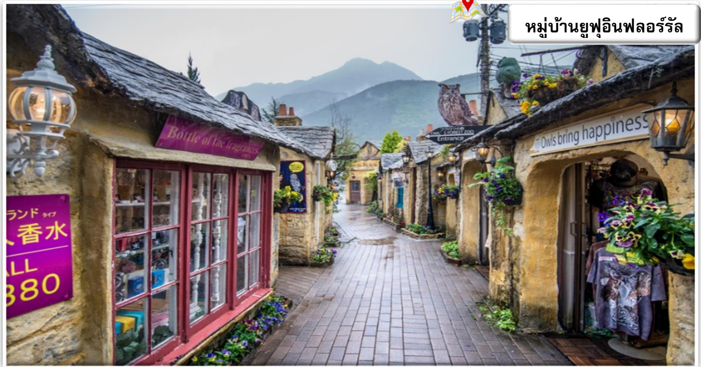
หมู่บ้านยูฟูอินฟลอรัล

เดินทางสู่ ยูฟูอิน (Yufuin) เป็นเมืองชนบทเล็กๆ ที่มีทัศนียภาพที่สวยงามมากโดยเฉพาะช่วงฤดูใบไม้ผลิที่จะมีทั้งดอกซากุระบนต้นไม้ และดอกเรปซีป ที่พื้นด้านล่าง พร้อมกับแม่น้ำ และภูเขา อีสระเดินชม หมู่บ้านยูฟูอินฟลอรัล เป็นหมู่บ้านจำลองสไตล์ยุโรป มีกลิ่นอายยุโรปโบราณ ไฮไลท์ ประจำเมืองยูฟูอิน บ้านอิฐที่แสนคลาสสิคเรียงรายอยู่บนถนนสายเล็กๆ ประดับประดาไปด้วยดอกไม้หลากชนิด