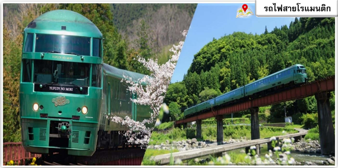
รถไฟสายโรแมนติก