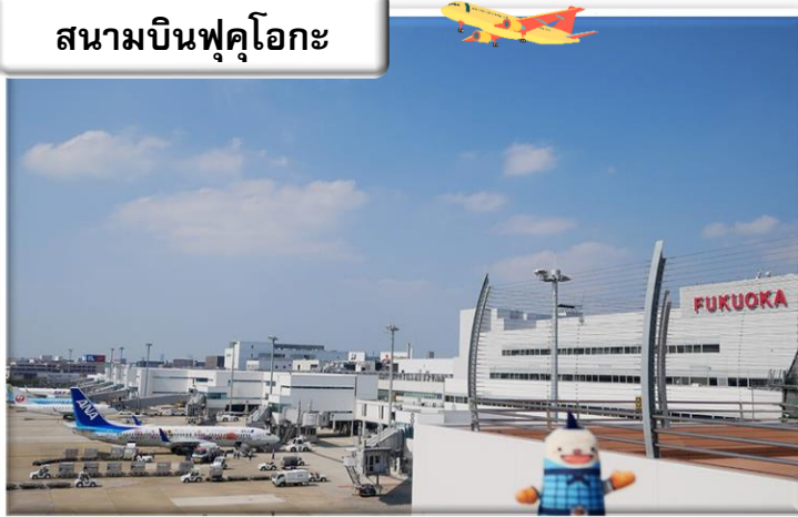
สนามบินฟุคุโอกะ

เวลา 00.55 น. ออกเดินทางสู่ สนามบินฟุคุโอกะ ประเทศ ญี่ปุ่น โดย สายการบินไทย เที่ยวบินที่ T5648