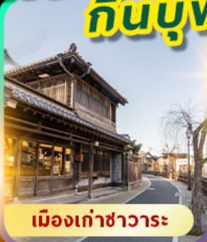
เมืองเก่าซาวาระ