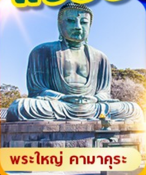
พระใหญ่ คามาคุระ