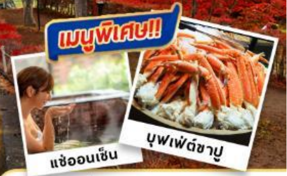
เขื่อนเซ็น