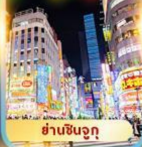
ย่านชินจูกุ