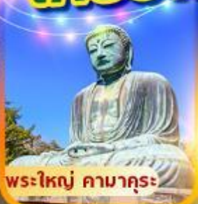
พระใหญ่ คามาคุระ