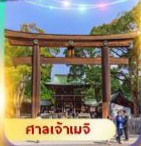
ศาลเจ้าเมจิ