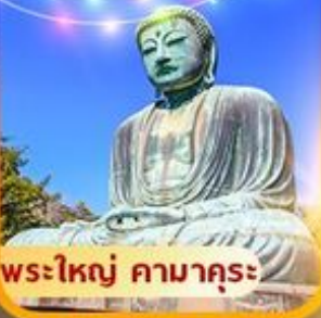
พระใหญ่ คามาคุระ