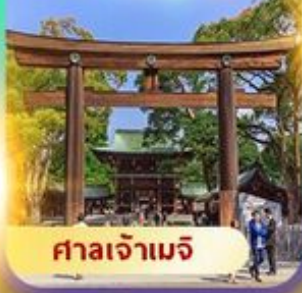
ศาลเจ้าเมจิ