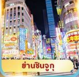
ย่านชินจูกุ