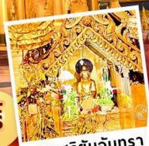
พระสุริยันจันทรา