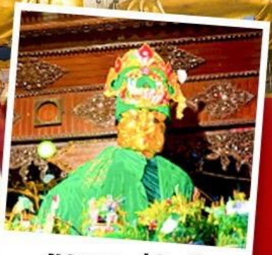
ขอพรแม่ยักษ์