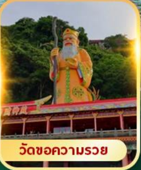
วัดขอความรอย