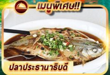
ปลาประรานาธิบดี