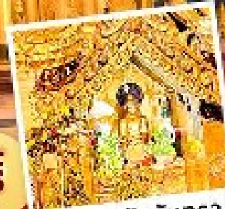
พระสุริยอินจันตรา