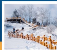
เขาทะเหล่ญา