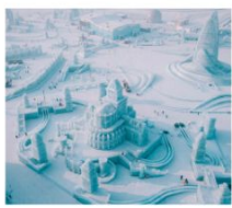
ICE AND SNOW FEST.

คฤหาสน์บอลคาร์ (ฟรีเล่น Snow Tubing) โบสถ์เซนต์นิโคลัส / มู่ตันเจียง / ชมแสงสีกลางคืนถนนสายเจียง เขาแกะหิมะ / เขาป้างดุย / ภาพเขียนสี ICE AND SNOW โบสถ์เซินโซเฟีย / เกาะพระอาทิตย์ / เทศกาลแกะสลักน้ำแข็ง