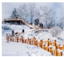
เขาแกะหิมะ

ฟรี!! ...ถุงมือ ผ้าพันคอ หมวก ท่านละ 1 ชุด