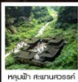
หลุมฟ้า สะพานสวรรค์

พระพุทธรูปเทสล่าหิน / หมู่บ้านโบราณผิงตี้ยิว อุทยานหลุมฟ้าสะพานสวรรค์ / เรือมังกรรถ / อุทยานเมฆาหวา ภูเขาโมก้า / Wulong Flying Kiss / เข็มปักถนนคนเดินเซี่ยฟางเปี๋ย เข็มปักหงหยาดัง / มหาศาลประหลาด / เมืองรถไฟฟ้าฤดูร้อน ถนนโบราณจีนแท้ / ศูนย์หมีแพนด้า