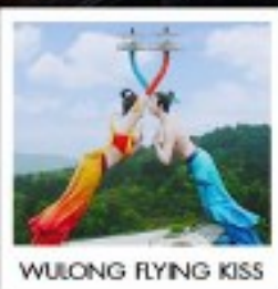
WULONG FLYING KISS