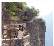
เขาเทียนเจียซาน