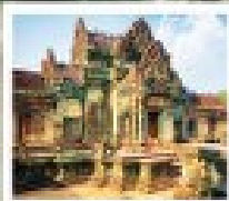
ปราสาทบันทายสี