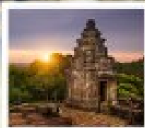
เขมบวาทึง

ทิวสิ่งศักดิ์สิทธิ์...ทอดยาว 400 เมตร ที่...น้ำตกพนมกุเลน