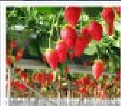
สวนผลไม้ฮามาบิตสึ