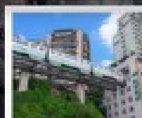
ตโม่งม่งตี่

ทัวร์คุณภาพธรรม ไม่ลงร้านฮ้อปปีง • ไม่ขายออฟชั่น