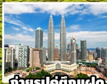
ถ่ายรูปคู่ตึกแฝด