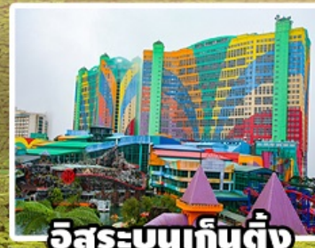
อิสระบนเก็นติ้ง