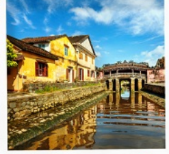
เมืองโบราณฮอยอัน