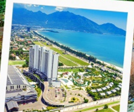
Mikazuki Japanese Resorts & Spa