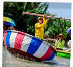
เรือกระดัง