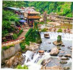
หมู่บ้านกิตกิต