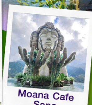
Moana Cafe Sapa