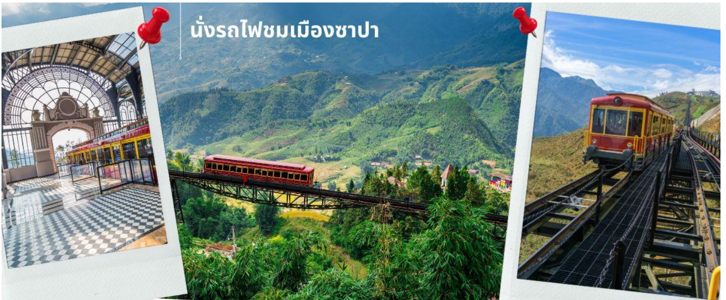
นั่งรถไฟชมเมืองซาปา

นำท่าน นั่งรถไฟชมเมืองซาปา (รวมค่ารถไฟชมเมือง) ท่านจะได้พบกับวิวทิวทัศน์ของเมืองซาปาที่เต็มไปด้วยความสดชื่น และสดกลิ่นอายธรรมชาติ และยังตื่นตาไปด้วยวิวกุเอา และนาขั้นบันได ที่มีชื่อเสียงของเมืองซาปาอีกด้วย ความยาวประมาณ 2 กิโลเมตร โดยใช้เวลาประมาณ 20 นาทีเพื่อไปสู่สถานีขึ้นกระเช้าที่จะนำท่านขึ้นสู่ยอดเขาฟานซีปัน