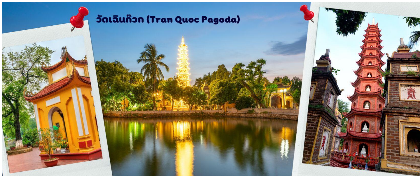
วัดเงินทิว (Tran Quoc Pagoda)

พระพุทธรูปศาสนา จากภาพมุมสูงของสถานที่ตั้ง ที่นี่เหมือนตั้งอยู่บนเกาะที่ยื่นลงไปในทะเลสาบ แต่มีเส้นทางคมนาคมเข้าถึงที่ สิ่งปลูกสร้างมีการวางผังเป็นอย่างดี ใช้สีสันทึกลมกลืนในโทนสีเหลือง น้ำตาล ตัดกับสีเขียวของต้นไม้ใหญ่ที่โอบล้อมอยู่ ในมุมถ่ายภาพจากอีกฝั่งหนึ่ง จะเห็นสิ่งปลูกสร้างสไตล์จีน และเจดีย์หลายชั้นโดดเด่น มีภาพที่สะท้อนลงสู่ผิวน้ำ เป็นภูมิทัศน์ที่งดงามทั้งยามกลางวันและยามค่ำคืนที่มีการเปิดไฟส่องสว่าง