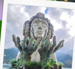
Moana Cafe Sapa