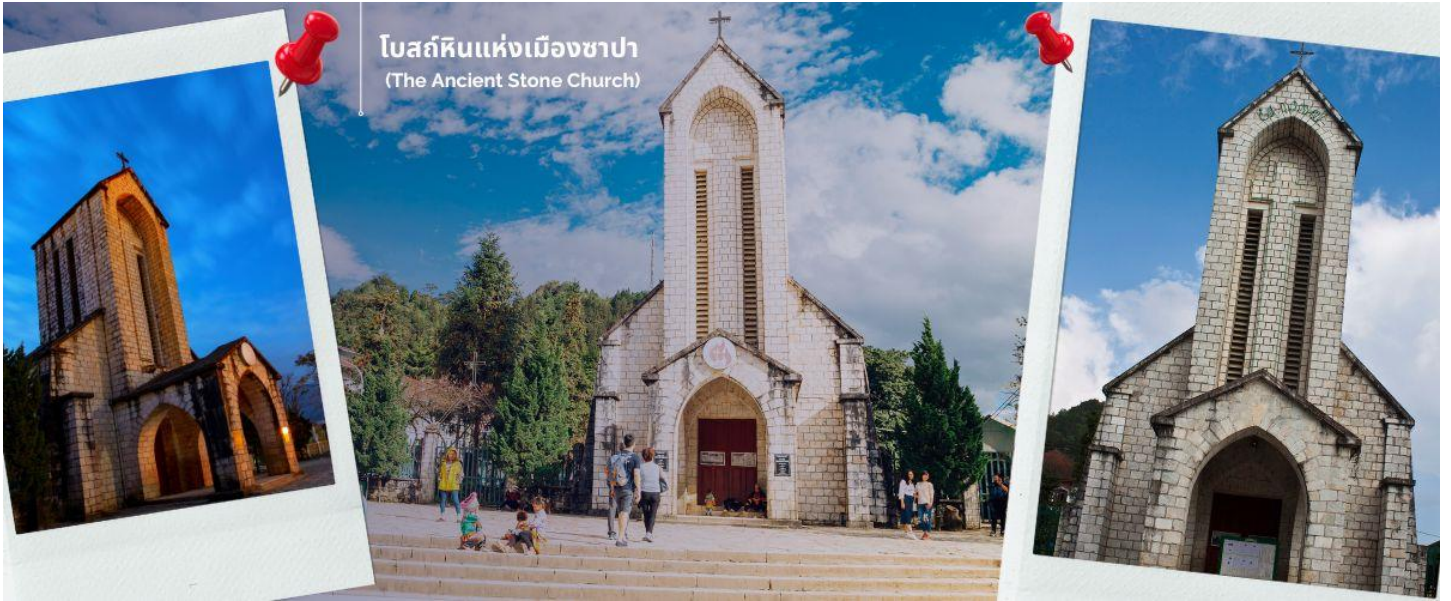
โบสถ์หินแห่งเมืองซาปา (The Ancient Stone Church)

นำท่านช้อปปิ้งที่ ตลาดไนต์เมืองซาปา มีสินค้าให้ท่านเลือกช้อปปิ้งมากมาย ไม่ว่าจะเป็นสินค้าพื้นเมืองของฝัาก ขนมห กระเป๋า รองเท้า ท่านสามารถช้อปปิ้งได้อย่างจุใจ