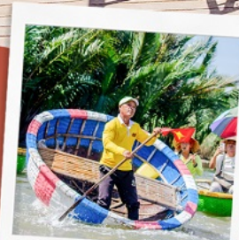
ล่องเรือกระดิง