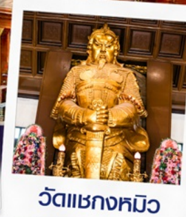
วัดเขากงหมิว