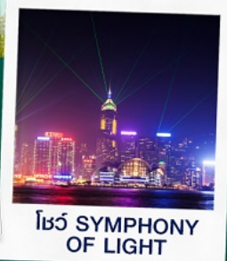
โชว์ SYMPHONY OF LIGHT