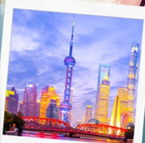
ทิวทัศน์