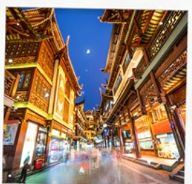
ตลาดเดินห้างเมี่ยว