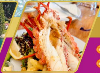
ทุ่งมัจกรท่ามกลางครั้งต่อ