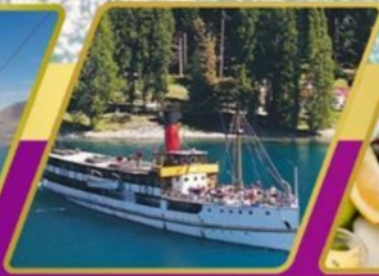
ล่องเรือกลไฟโบราณ อาหารแบบ BBQ ที่วอลเตอร์ฟิค ฟาร์ม