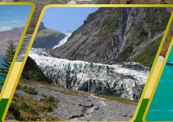
ธารน้ำแข็ง FOX GLACIER