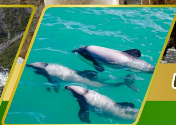
ส่องเรือชมโลมา อ่าวอาคารัว