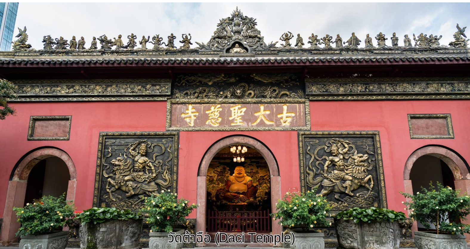
วัดต้าจื่อ (Daci Temple)

เช้า บริการอาหารเช้า ณ ห้องอาหารของโรงแรม