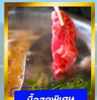
มือสุดพิเศษ