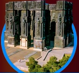
อนุสาวรีย์ประวัติศาสตร์

48,888 23-28 ต.ค. 67 เหลือ 10 ที่ 41,111