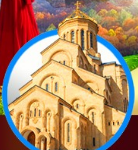
โบสถ์กรินดี เมืองทบิลีซี