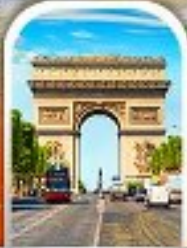
ARC DE TRIOMPHE FRANCE