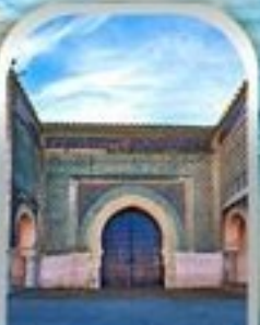
KASBAH OF MOULAY ISMAIL