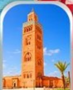
JEMAA EL-FNAA MARRAKESH