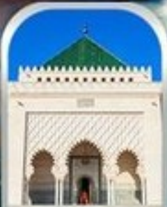
MOHAMMED V SQUARE