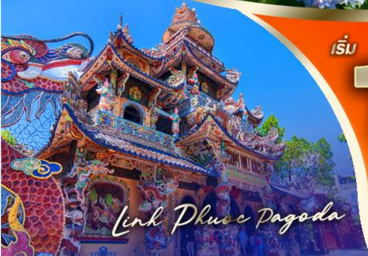
Link Phuc Pagoda