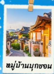
หมู่บ้านนูกซอน